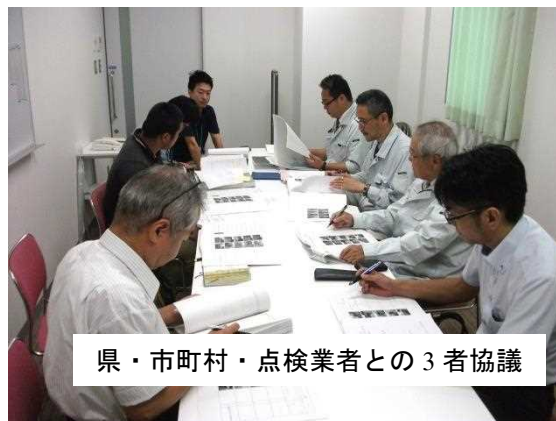
県・市町村・点検業者との3者協議