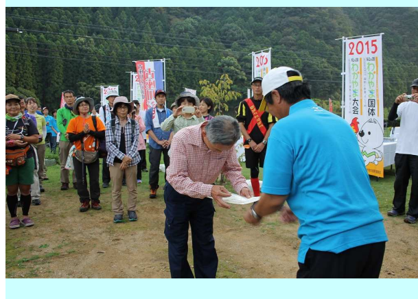
閉会式（完歩賞授与）