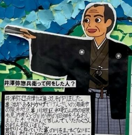
井澤弥惣兵衛って何をしました?