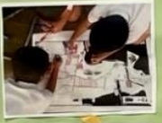
亀の川・用水路調査!

～亀池につながる用水路～ わたしたちは、亀池につながる用水路を調べました。亀池から用水路をつなぐ方法を調べました。亀池から用水路をつなぐ方法は、ポンプで亀池の水を用水路にひくはした。