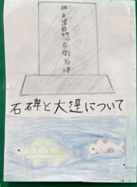
石の碑と大堤について

～亀池について～ ●亀池は湛水面積約3ha、工事に1年9か月かかった。 ●亀池は三百年たってもかわりなし。池には、水をためる教室をマヌにして2000㎡、1日中流し絶たれても75日分ある。昔は鉄のスコップなどがなかった。木のスコップを使っていた。●亀池を造る前は茶臼池という小さな池が湧はしの下あたりにあった。