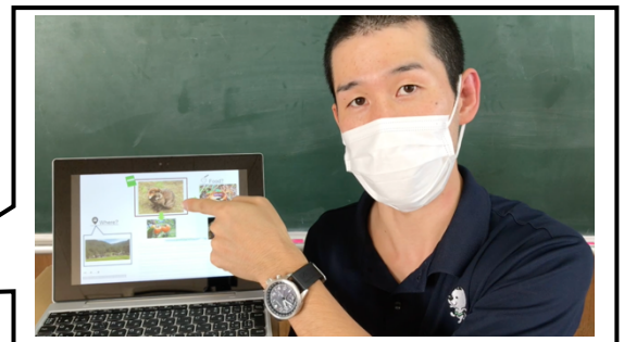
画像2 (QRコードを読み取った際の動画の様子)