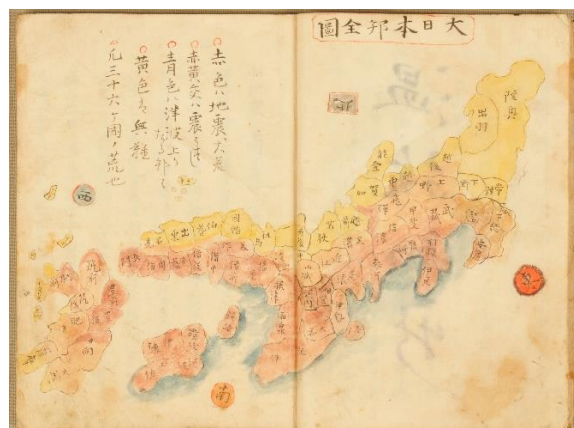
安政聞録 全国の被害状況の図