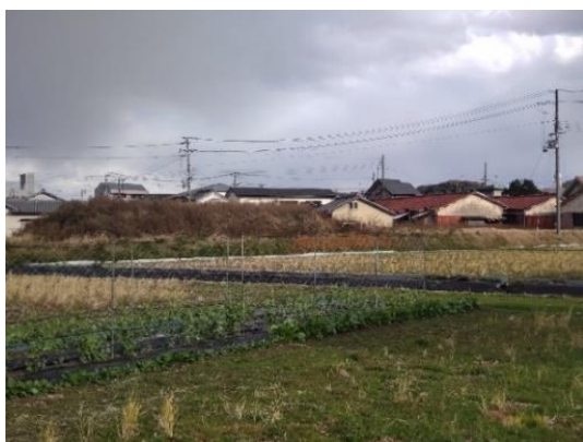
写真1 太田城水攻め堤跡(西から)

①・②の調査の結果、和歌山市出水に所在する堤状遺構は太田城水攻めの際に築かれた堤跡と考えられ、雑賀衆の解体と近世和歌山城下町建設の契機となった重要な戦いの跡を残す遺跡として学術的価値が高いことから、条件の整った南側の盛土遺構を和歌山県指定文化財〔記念物(史跡)〕に指定して保護を図ることとなった。