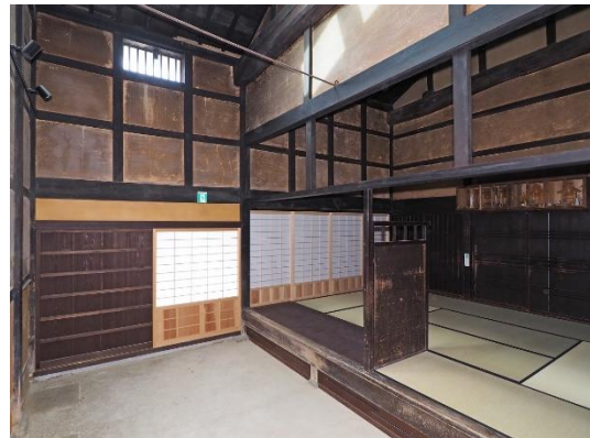
主屋 トオリニワからダイドコロを見る