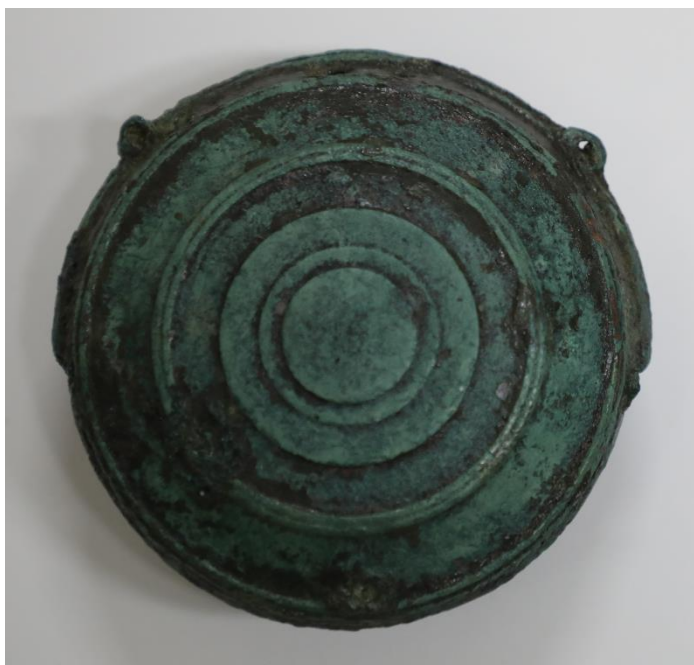
鷺ノ森遺跡出土鱧口

このように鷺ノ森遺跡出土鱧口は、鱧口の変遷を考える上でも重要な資料であり、現存する最古級の作例として学術上の価値が高い。