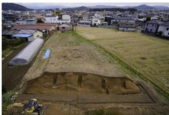
写真2 堤跡の発掘調査状況(北西から)