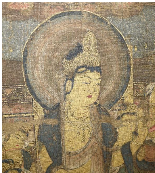
阿弥陀三尊のうち勢至菩薩