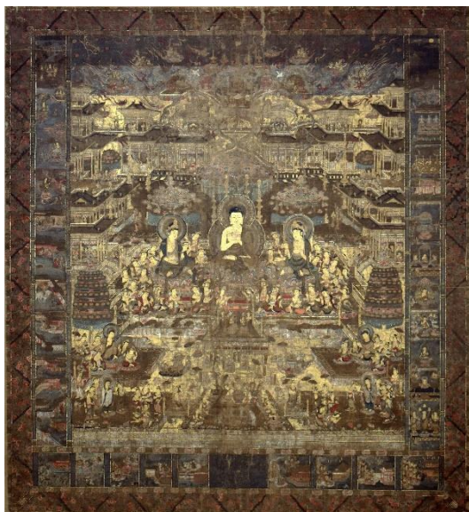
絹本著色当麻曼陀羅図 全図

このように、本作は、県内の西山浄土宗の有力寺院である総持寺に伝来する、14世紀前半に遡る数少ない当麻曼茶羅図のひとつとして価値が高い。