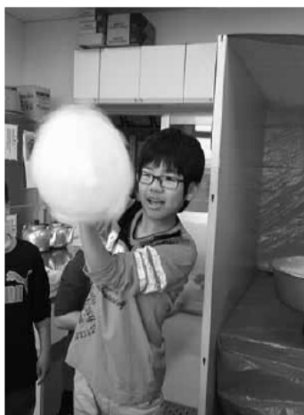
わたあめを作る子供