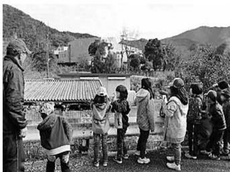
バードウォッチングの様子