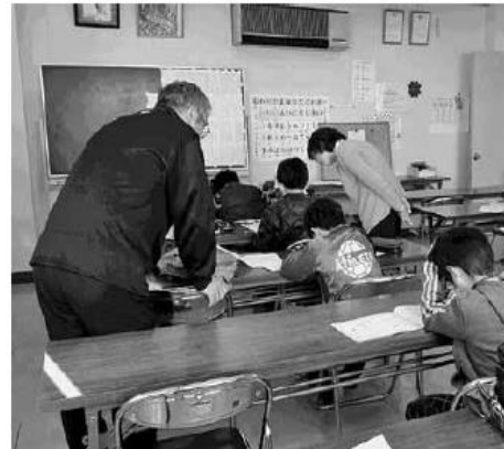
宿題に取り組んでいます