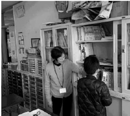
分からないことは調べます