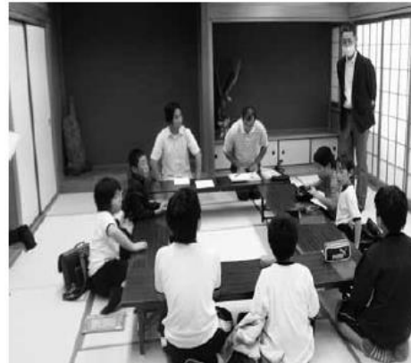
第1回での自己紹介の様子