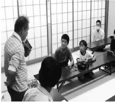
指導員が好きな三葉虫の説明の様子