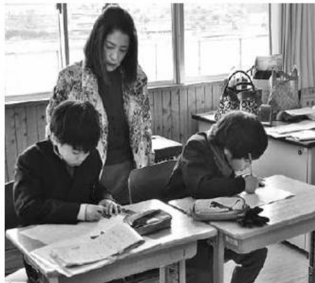
一生懸命宿題に取り組む様子