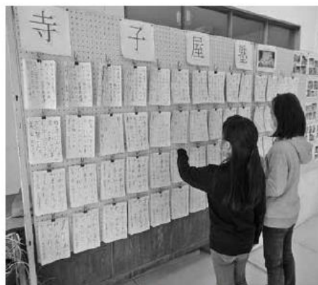
書き方教室の作品