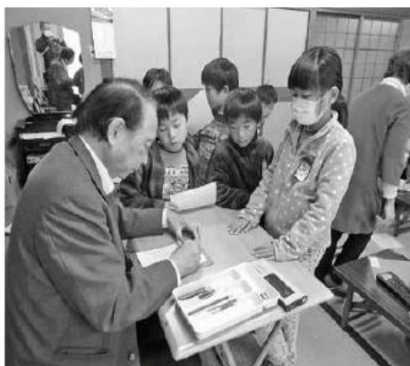
書き方教室の様子

書き方指導の先生からは、「子供たちの笑顔がうれしく、楽しい時間を過ごすことが出来ました。これからも努力することで、技能が向上するのを感じ取らせたい。また、何事にも一生懸命取り組む態度が育ってくれることを願っています。」との声をいただいた。