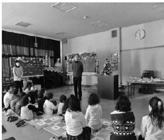
南野上公民館長の話聞く子供たち

劇団のお兄さんお姉さんの劇やパフォーマンスが楽しかったです。また、ケーキは自分で飾り付けすることができ、楽しかったです。（児童）