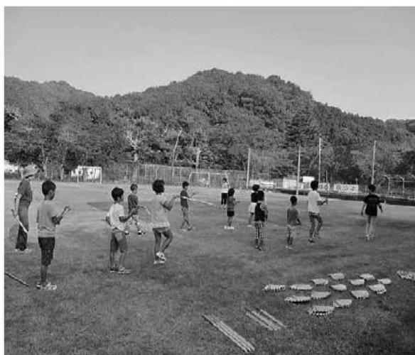
亀の川念仏踊りの練習をする子供たち

夏休み終了後に参加児童に対して実施したアンケートでは、全員が「楽しかった」と回答してくれた。また、保護者から、夏休みに乱れがちになる生活リズムの改善にもなるとの感想もあった。