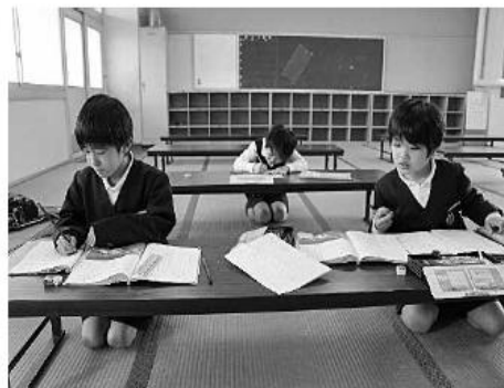
学習のきまりと、学習中の様子。 正座をして静かな環境で取り組んでいる