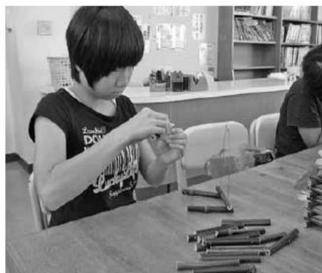
黒竹を使った工作