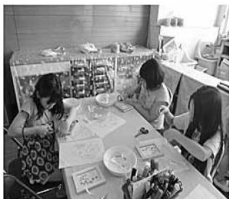
(工作) 協力し合いながらベニヤ板を切っています。