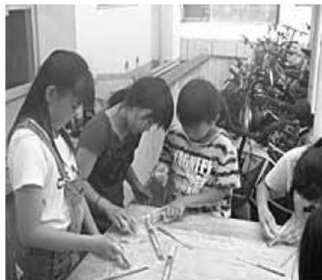
(手芸) デコフォトフレーム作成に取り組んでいます。