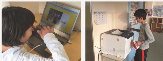
学習支援サービスを活用する児童たちの様子

配付されたIDでインターネット上のサービスに接続し、タブレット等に問題を表示して学習します。採点結果は学習履歴として蓄積され、学校や保護者は学習履歴を閲覧することで子供たちの学習をサポートします。