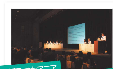
アジア・オセアニア 高校生フォーラム全体会の様子