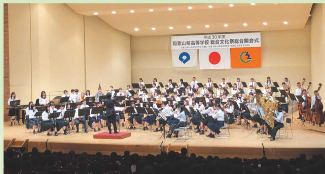
県高等学校総合文化祭総合開会式の様子

高校生が主体となって創り上げる全国高等学校総合文化祭。高校生の皆さんの活躍を大いに期待しています。