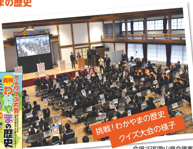
挑戦!わかやまの歴史クイズ大会の様子