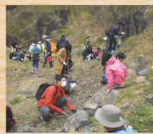
■化石採集イベントの様子