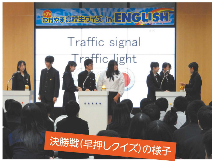
決勝戦(早押しクイズ)の様子

「わかやま何でも帳」は和歌山の自然、歴史、文化や先人たちなど「ふるさと和歌山」のすばらしさを広く知ってもらうため、県内の小・中・高等学校及び特別支援学校において、授業や調べ学習等で活用しています。