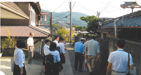
安全マップづくり視察の様子