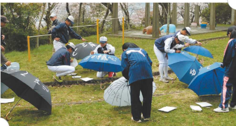
「なつボラ」(野球部)の様子