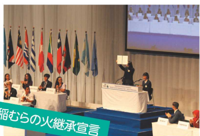
稲むらの火継承宣言

また、「和歌山県高校生英語ディベート大会」を開催し、英語によるディベート活動を通して生徒のコミュニケーション能力の向上や物事を多角的な視点からとらえる態度の育成をめざしています。