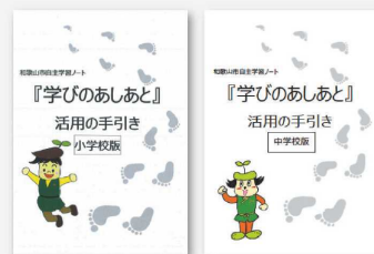
『学びのあしあと』活用の手引き

子供たちが家庭で基本的な学習習慣を身に付け、意欲的に学習に取り組めるように、平成29年度に自主学習ノート『学びのあしあと』活用の手引き(小学校版)を作成しました。今年度は中学校版を作成し、9年間を通して自ら課題を追求し、自己実現していく力の育成をめざしています。