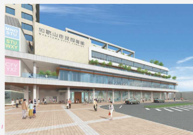
新・和歌山市民図書館(イメージ)

閲覧席のほか、ちょっとおしゃべりできるくつろぎのスペース、サイレント学習席、子供のフロアも充実。館内 Wi-Fi も完備。移民資料室や郷土資料のエリアもあります。訪れた人をより豊かにする図書館が誕生します。