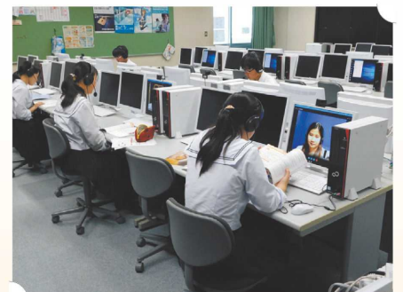
オンラインスピーキングトレーニングの様子