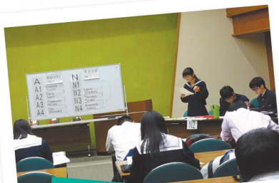
英語ディベート大会の様子