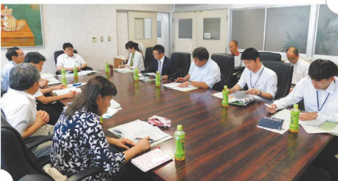
中高一貫学校地域連携推進委員会での協議の様子

高校の3年間は、アウトプット期。コミュニティ・スクールの仕組みにより、地域に根ざしたボランティア活動を充実させながら、さらに地域の課題に対する地域貢献活動へと広がっていきます。