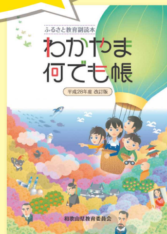
和歌山県版ふるさと教科書『わかやま何でも帳』