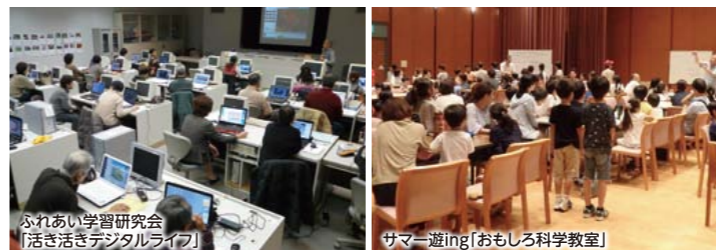
ふれあい学習研究会「活き活きデジタルライフ」