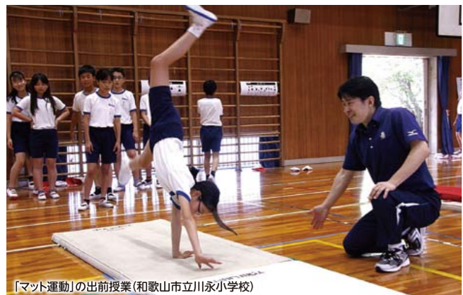
「マット運動」の出前授業（和歌山市立川永小学校）

スポーツ、科学、芸術、文化など、様々な分野のエキスパート職員の指導によって、子供たちの好奇心や探究心を育てています。