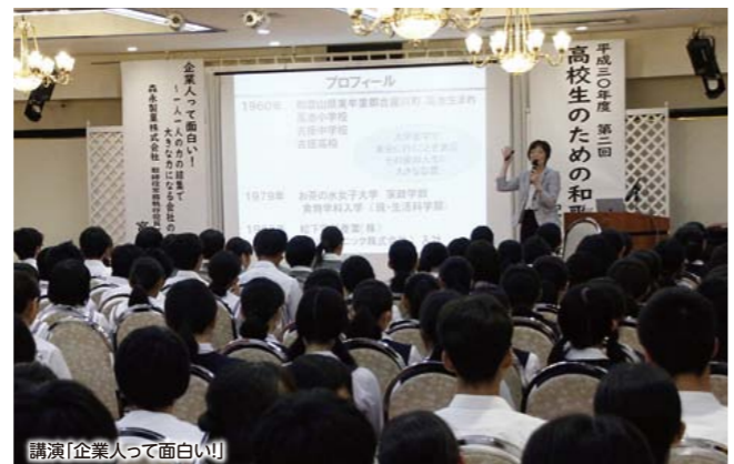
講演「企業人って面白い！」

「最前線の話が聞きたい」「自分の興味を深めたい」など、生徒の学びに対する意欲に応える場となっています。