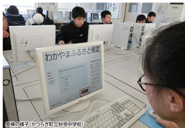
受検の様子（かつらぎ町立妙寺中学校）