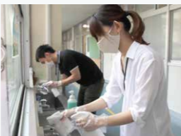
感染症予防に 努める教職員

A 食事前後の手洗いを徹底します。食事の際には、向かい合わないようになり、会話を控えます。食後は、使用した机やテーブルを消毒します。