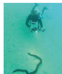
クテナイオオイカリナマコ

今年の特別展はナマコに注目!ナマコの色々な種類や生態系の中での役目など、わかりやすくご紹介いたします。巨大なナマコや、和歌山県で初めて見つけられ新種となったナマコなども展示します!ぜひご覧ください!