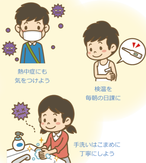
熱中症にも 気をつけよう