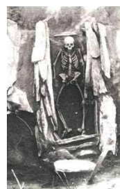
地ノ島3号石棺出土人骨

縄文時代の墓や古墳から出土した人骨、集落から出土した動物の骨や歯、角などを紹介し、「骨」から人々の生活や埋葬の歴史を探ります。