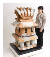
大日山35号墳 家形埴輪

いましろつか 今城塚古墳などヤマト政権の有力古墳で出土した埴輪群と大谷山22号墳や大日山35号墳、井辺八幡山古墳をはじめとする岩橋千塚古墳群の埴輪群などを紹介し、紀伊の人々が古墳で執り行った葬送儀礼について考えます。