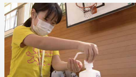
こまめな手洗い・消毒が大事

A 不安や悩みがある場合は、学校の先生に気軽に相談してください。また、学校では、スクールカウンセラーに相談することもできます。 さらに、和歌山県では、子供SOSダイヤル(073-422-9961)や新型コロナウイルス感染症専用相談窓口(健康相談)[和歌山県のホームページを参照]なども開設しています。