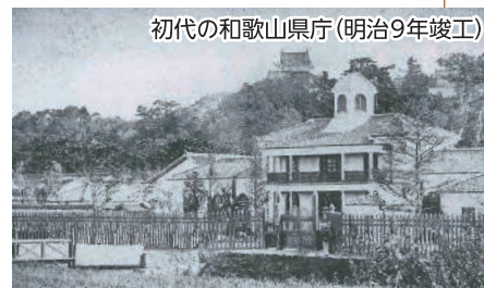
初代の和歌山県庁(明治9年竣工)