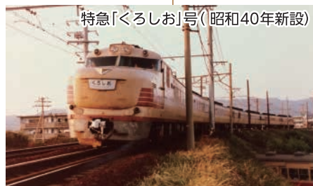
特急「くろしお」号(昭和40年新設)