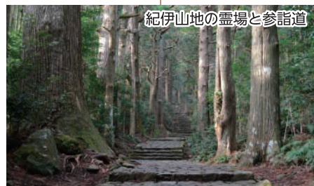
紀伊山地の霊場と参詣道