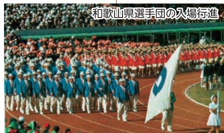
和歌山県選手団の入場行進