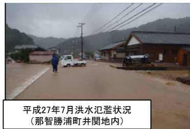
平成27年7月洪水氾濫状況 (那智勝浦町関内地区)