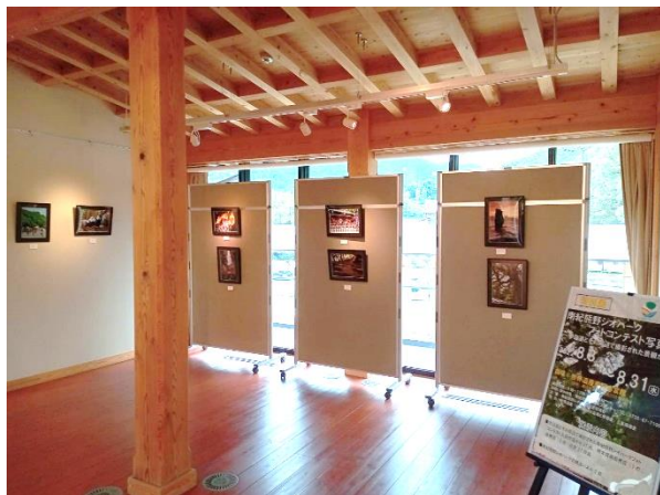
フォトコンテスト入賞作品展示（昨年の様子）