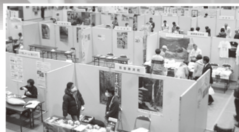
※過去開催フェスタの様子です。