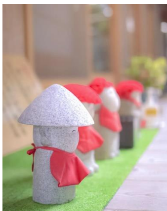
撮影場所：救馬溪観音 アカウント名：sw.photo_1