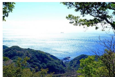
撮影場所：熊野古道大辺路長井坂 アカウント名：kumano_photo_