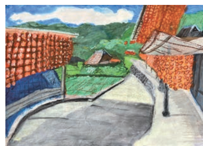
「カーテンみたいな吊し柿」