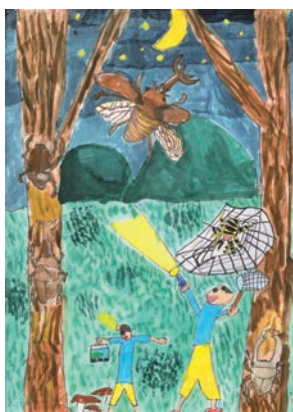
「夜に虫とりをしたよ」