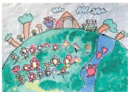
「山でお兄ちゃんと鬼ごっこしてる」