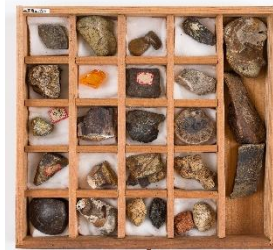
鉱物標本筆筒(黒筆筒)のうち2段