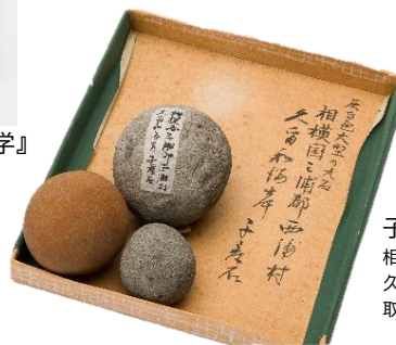
子産石 相模国三浦郡西浦村(現 横須賀市) 久留和海岸採集 1921年に受け 取ったものか