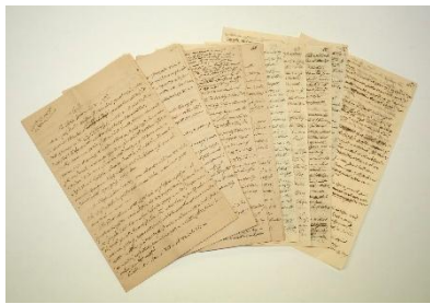
「驚石考」原稿(南方熊楠顕彰館蔵[原稿 0016])