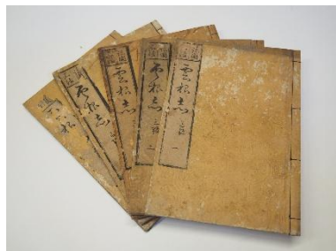
木内石亭(重暁)『雲根志』 (南方熊楠顕彰館蔵[和古 620.07])