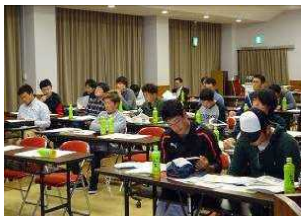
セミナー受講中のクラブ員たち