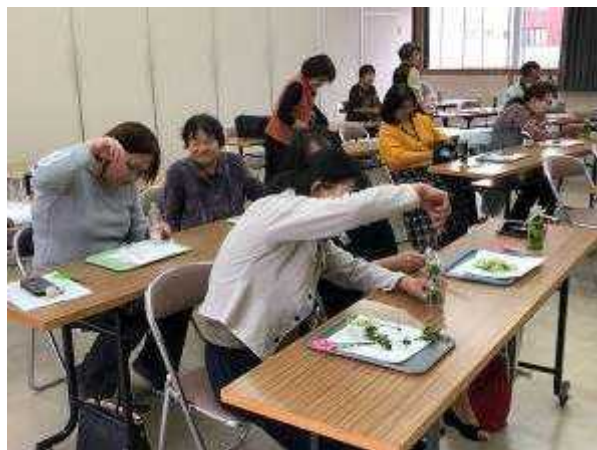
研修会(ハーバリウムづくり)