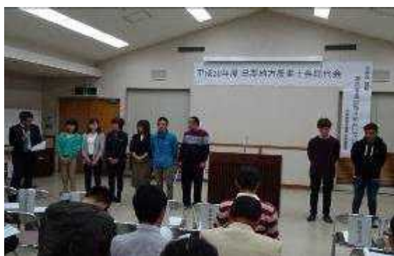
農業士認定者の紹介

総会に続き、研修会が開催され、農業水産振興課から「普及事業の取り組みについて」と題して、平成27～29年度の普及活動実績と平成30～32年度の普及指導計画について、担当の普及指導員から報告した。参加者らは各課題について熱心に聞き入っていた。