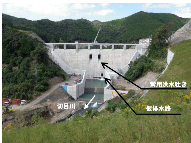
下流からダムサイトを望む(平成26年10月)

形 式：重力式コンクリートダム 洪水調節方式：自然調節方式 堤 高：44.5m 堤 頂 長：127.0m 総貯水容量：396万m 3