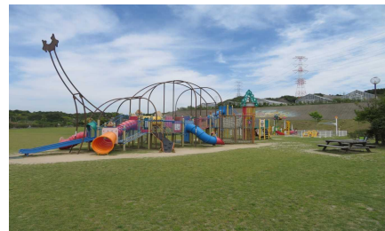
御坊総合運動公園