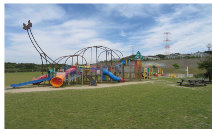
御坊総合運動公園