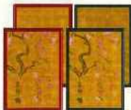
（左から順に） 蒔絵ご朱印帳（黒） 蒔絵ご朱印帳（赤）