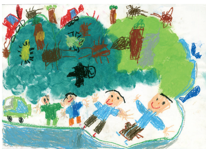
「山へ虫とりに行くよ」