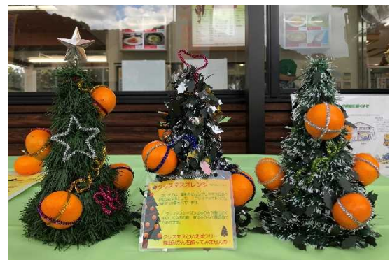
配布予定の卓上みかんツリー