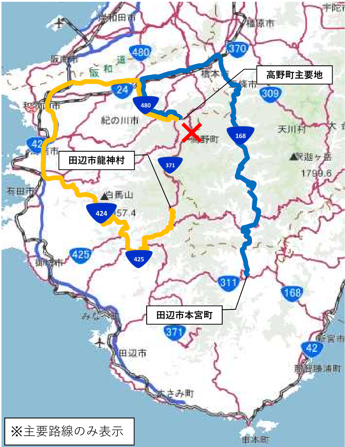
迂回ルート図 (観光バス等大型の車両)