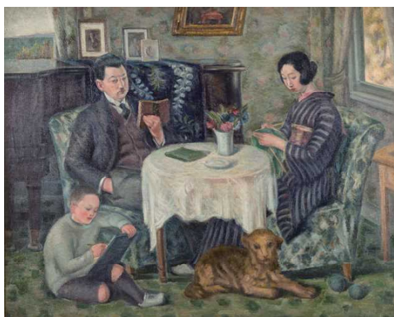
『家族の肖像』 (大正末～昭和初期)