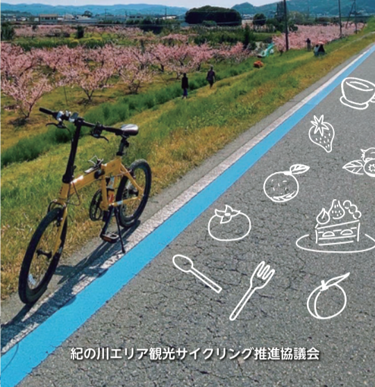
紀の川エリア観光サイクリング推進協議会