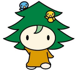
紀の国ふるさとづくり マスコットキャラクター キノピー