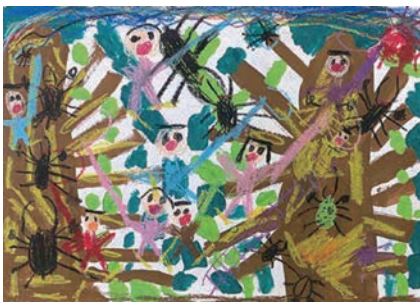
「木に登って虫捕まえてる」