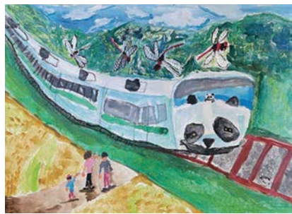
「パンダ列車が前を通った！」