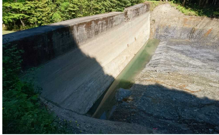
土砂撤去後(椿谷川)