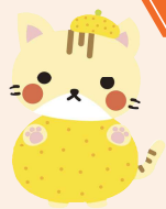
海南市PRキャラクター 海ニヤン

海南海草地方広域観光協議会 (事務局 和歌山県海草振興局企画産業課) 〒640-8585 和歌山市小松原通一丁目1番地 ☎073-441-3375