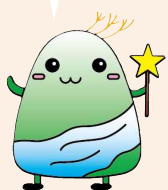
紀美野町イメージキャラクター きみちよん