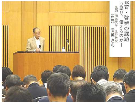
同和運動推進月間 特別講演会（R1.11.14）