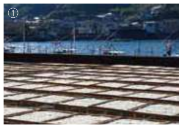
①雨天の場合 しらすの天日干し体験が不可能な場合、マイクロモンスターのミニ標本製作に変更になります。また、ミニ標本は別途2000円でも製作できます。お土産にしらす干しパック入り(小)をどうぞ!