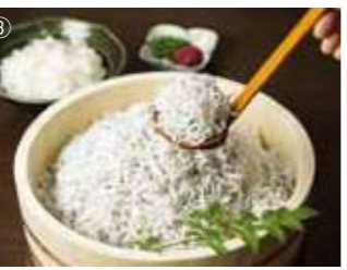
③お昼は好きなだけ釜あげしらすを盛りつけられる丼を堪能!