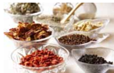
中国の本場から仕入れた薬草を中心に、和歌山産の薬草も