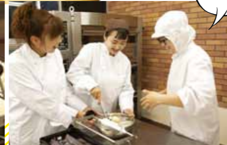
スタッフさんが丁寧に教えてくれる