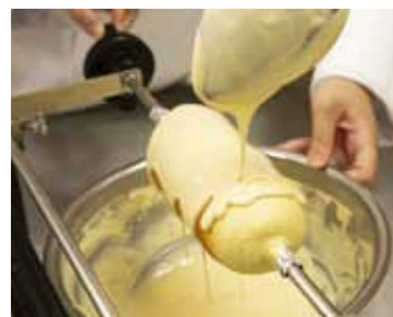
特製生地の種類は、日によって替わる。 どんな生地かはお楽しみ