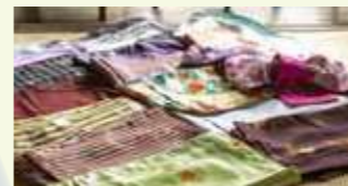
着物選びはとっても楽しいけど迷う。店主にコーデを相談しよう