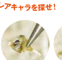
カワハギ レア度 ★★★☆☆