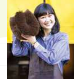
でっかいタワシづくり 16500円(税込)