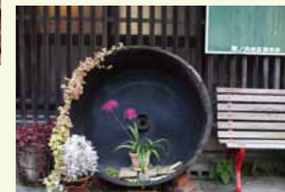
漆のタルを活用したオブジェが家々の前に。かわいい!