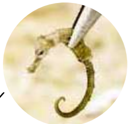
タツノオトシゴ レア度 ★★★★★