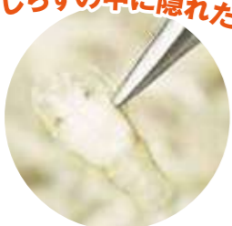
セミエビのなかま レア度 ★★★★★