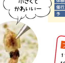
イカ レア度 ★☆☆☆☆