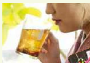
散策の後は、サロンにてオリジナルブレンドティーで一服♪

ヘアサロンで着付けとヘアメイクをしてもらい、街歩きへGO!おっと、忘れちゃいけない。おでかけ前に黒江の街をおトクに楽しめるクーポンももらって行こう。思う存分、街歩きを楽しんだら、ゆっくりティータイムでリラックスしてね!