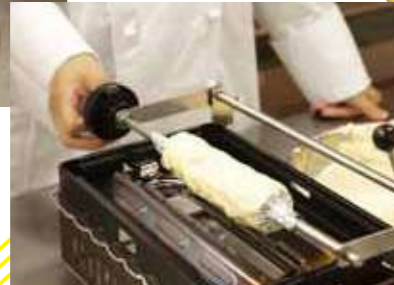
コンロの上でくるくる回して。 こんがり焼けたら、また生地をかけて!