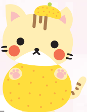
紀美野町イメージキャラクター きみちよん