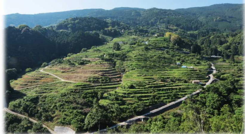
紀美野町 中田の棚田