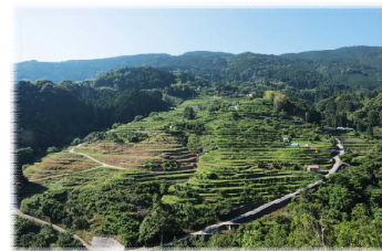
紀美野町 中田の棚田