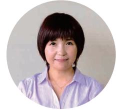
a spoonful of suger 公認心理師・臨床心理士

周りと比べ、自分も認められたい、結果を出したいという欲求が出ることは、成長の証ともいえます。一緒に気持ちを整理しながら、何を大切にしてほしいのかを伝え続けていくことで、さらなる成長の機会になると考えられます。