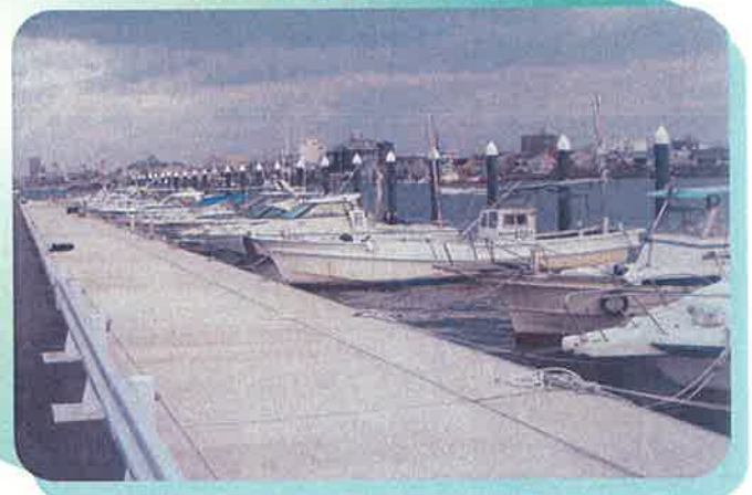
適正保管された船舶