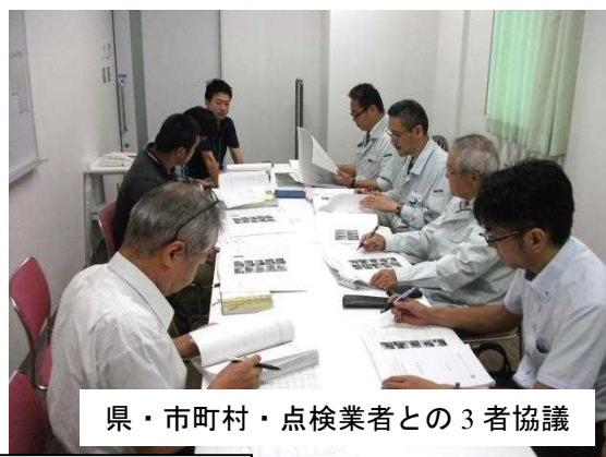
県・市町村・点検業者との3者協議