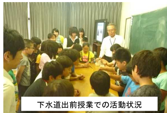
下水道出前授業での活動状況