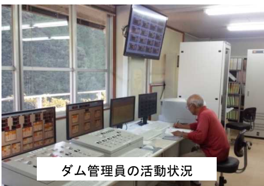
ダム管理員の活動状況