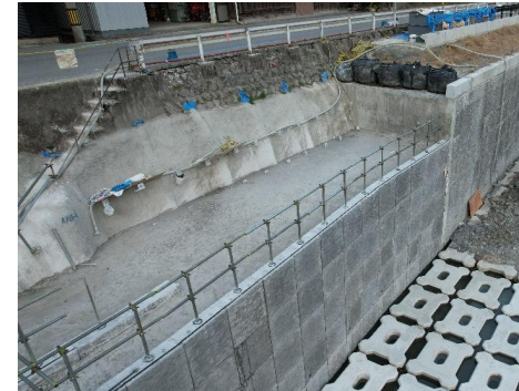
●墜落防止のための防護柵設置