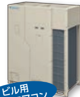
ビル用 マルチエアコン