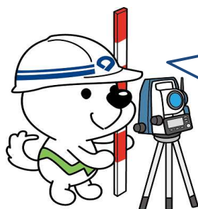
和歌山県PRキャラクター 「きいちゃん」