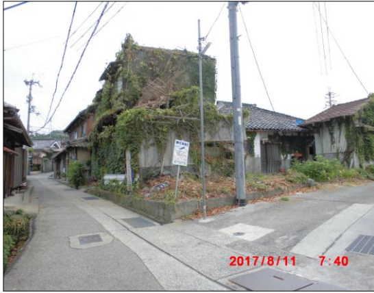
代執行開始前(平成29年 8月11日)