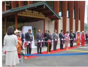
テープカットの様子