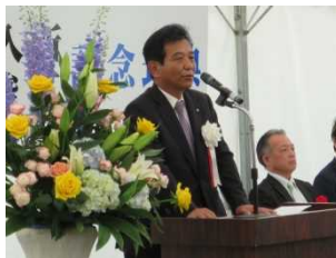
寺本那智勝浦町長 挨拶