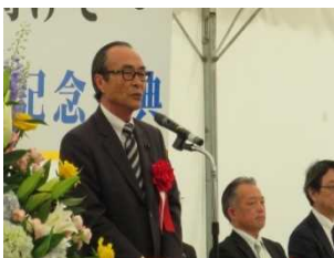
前芝県議会議長 閉式の辞