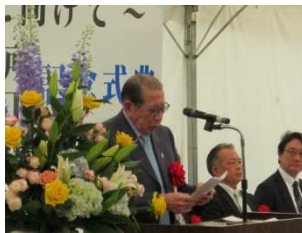
綿貫全国治水砂防協会会長 来賓祝辞