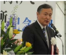
山田国土交通省 近畿地方整備局長 挨拶