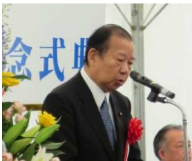
二階衆議院議員 来賓祝辞