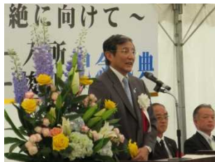
仁坂和歌山県知事 挨拶