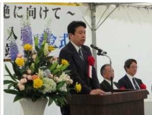
鶴保参議院議員 来賓祝辞