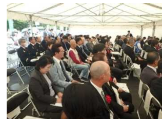
式典会場内の様子