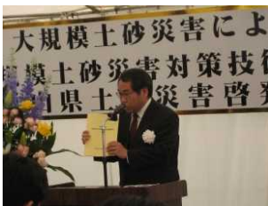
黒川センター長からの研究成果報告

来賓および主催者により、テープカットおよび看板の除幕を執り行ったのちに、センターの内覧を行いました。